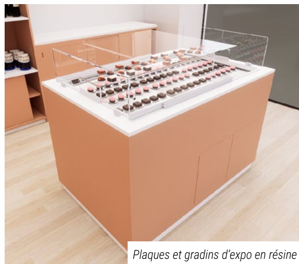
Plaques et gradins d'expo en résine